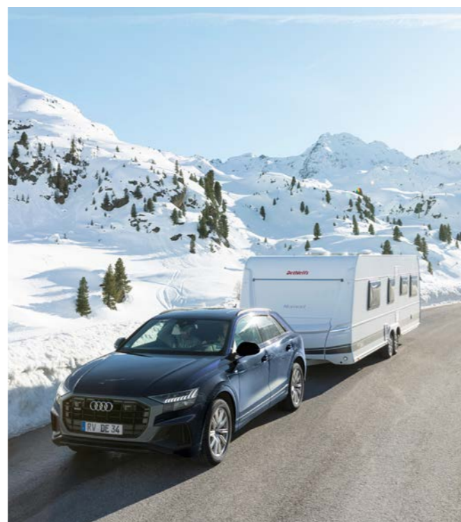
Kom sikkert gennem den kolde årstid med en vintersikker campingvogn med vinterkomfort-pakke som ekstraudstyr fra Dethleffs.