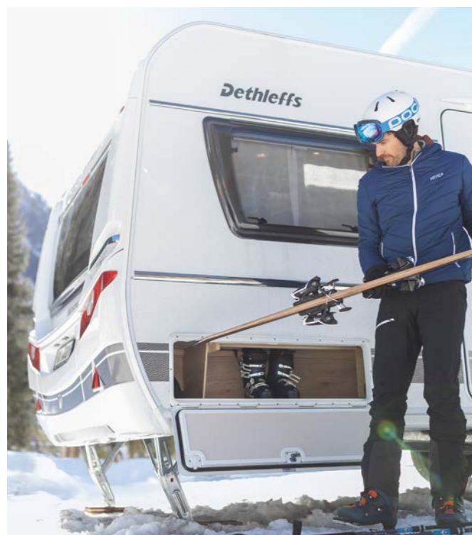
En ferielejlighed direkte ved siden af skipisten, hvor der er dejligt varmt indenfor ligesom derhjemme.

Med dette udstyr, der er baseret på mange års erfaring, vil der selv på bitterkolde nætter være rigeligt varmt i din campingvogn, og vandanlægget fryser ikke til.