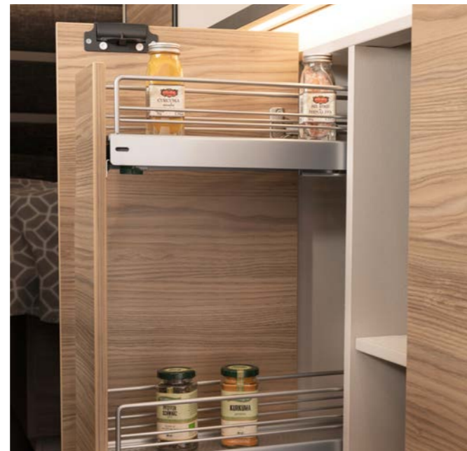
Lige ved hånden! Der er plads til krydderier, konserves og endda store flasker i de komfortable udtrækskuffer (modelafhængigt).