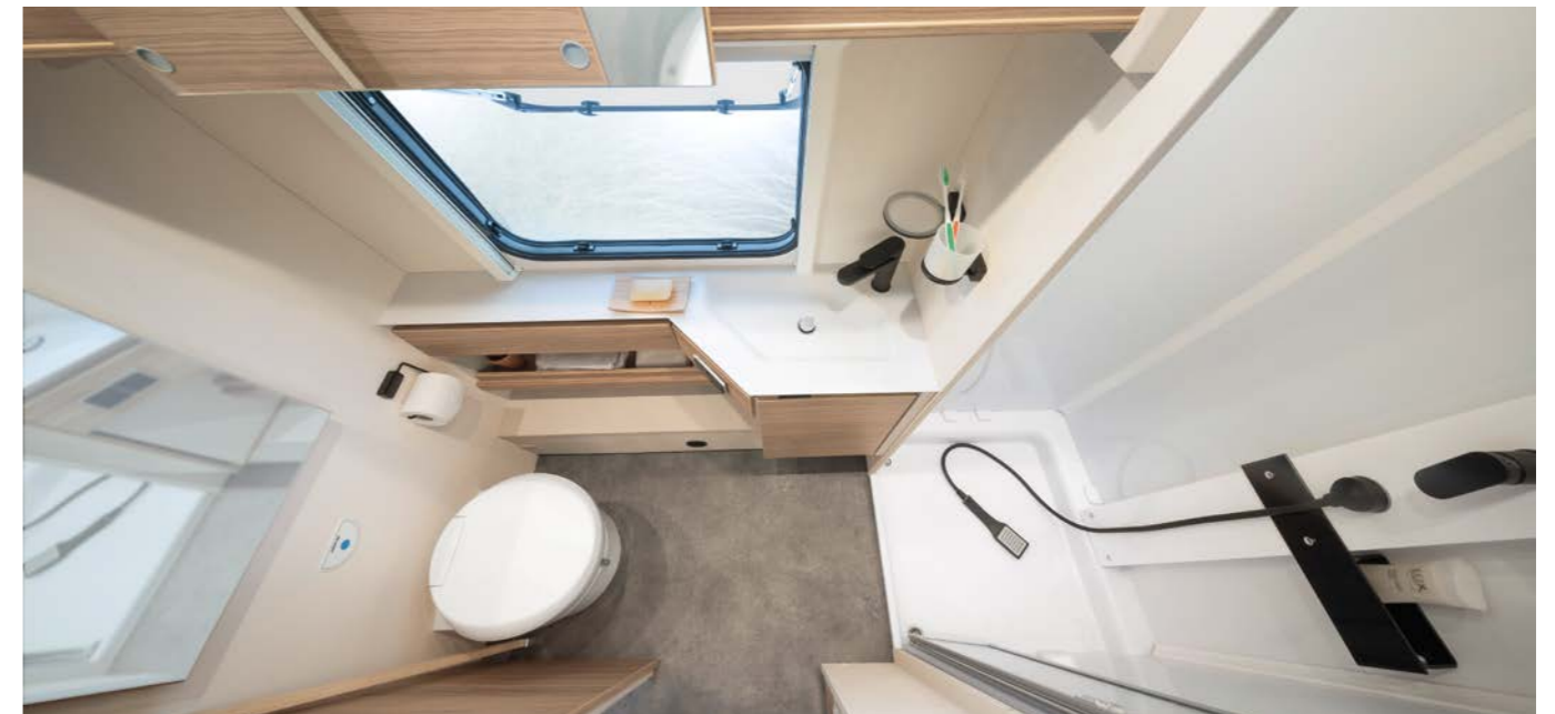
I det store bad i bagenden med separat brusekabine er der dejlig stor bevægelsesfrihed. Det store vindue med myggenet og mørklægningsrullgardin sørger for den nødvendige udluftning efter brusebadet. • 490 EST