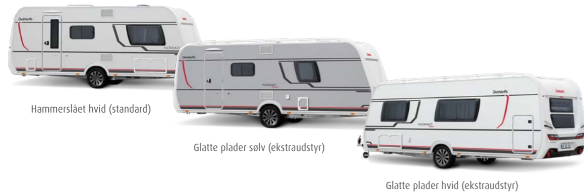
Hammerslået hvid (standard)