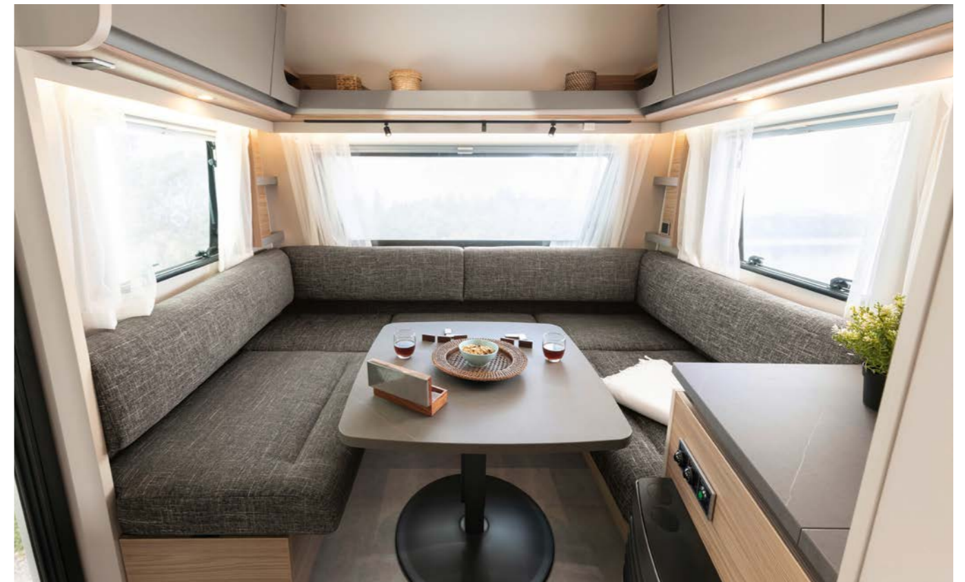
Svævende ryglæn, åbne hylder og elegante hjørneelementer giver et rum med let og luftig fornemmelse. Siddegruppen kan efter ønske ombygges til endnu en dobbeltseng. • 490 EST