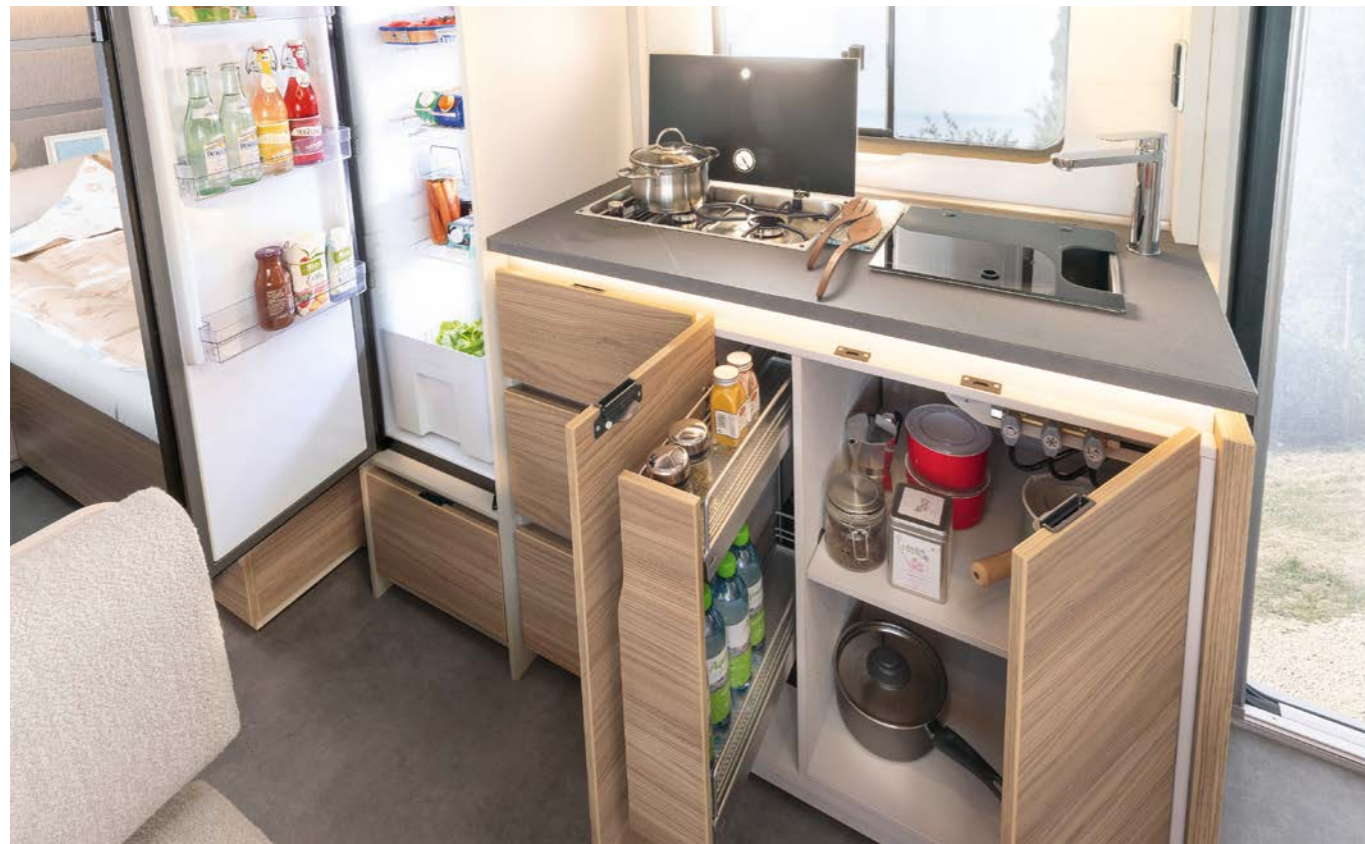
Et fuldstyret køkkencenter med masser af plads og opbevaringsplads giver gourmetglæde under ferien. De kantfrie køkkenafdækninger er særligt elegante. • 490 EST