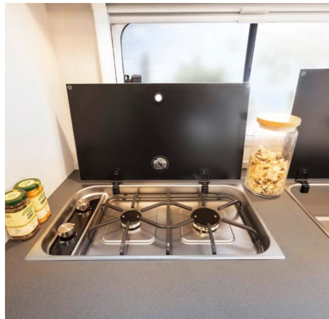
De massive gryderiste vidner om kvaliteten. Brænderafstandene er valgt, så man også virkelig kan lave mad med en stor pande og en gryde samtidigt.