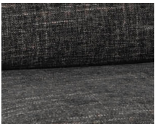
+ Stofkombination Lona ○