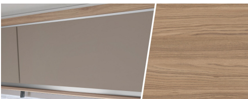
+ Trædekor Ashton