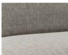
+ Stofkombination Mount ○