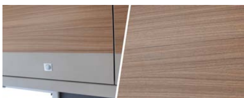
+ Trædekor Rosario Cherry