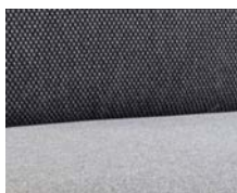
+ Stofkombination Galaxy ○