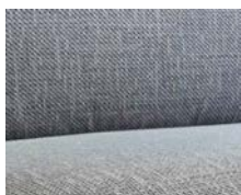
+ Stofkombination Cloud