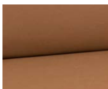
+ Stofkombination Estepona ○