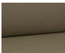
+ Stofkombination Manilva ○