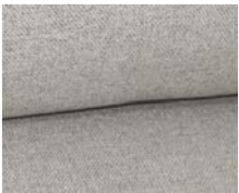
+ Stofkombination Chromo ○