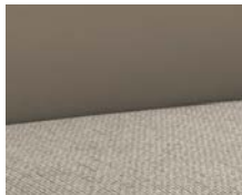
+ Stofkombination Champion ○