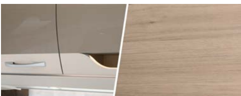
+ Trædekor Noce Nagano