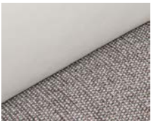
+ Stofkombination Ruby