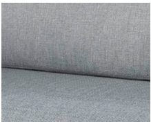
+ Stofkombination Amposta