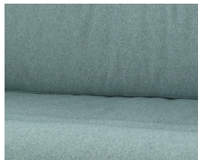
+ Stofkombination Badalona ○