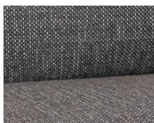
+ Stofkombination Floyd