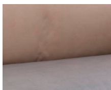
+ Stofkombination Duke ○