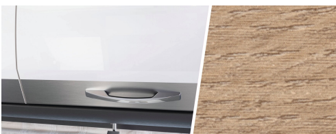
+ Trædekor Ambers Oak