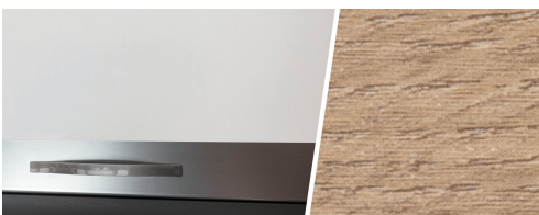
+ Trædekor Amberes Oak